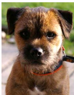
Ill. „Rind“, „Border Terrier“ und „Katze“