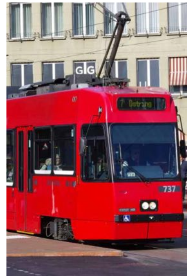
ILL. „BERNER TRAM“